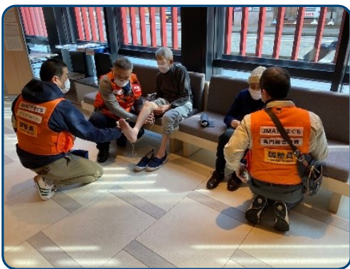
ホテルのロビーで診察と 健康相談を行った

このたび山口県医師会の派遣要請を受けて「JMAT やまぐち」として石川県で医療支援活動を行って来ました。「JMAT やまぐち」が与えられた活動内容は能登半島の1次避難所から金沢市以南のホテルや宿泊施設、約250カ所の2次避難所へ避難されてきたおよそ5200人の方たちの健康状態を把握するべく、その中から金沢市内の31施設を割り当てられ施設をまわり、必要があれば診察、処方、健康相談を行うものでした。しかしながら、ビジネスホテルなど一つ一つ訪ねる訳にもいきません。そこで、金沢市内の保健師と情報を共有、共働することが大事と考え、金沢市の保健所へ赴き情報を共有し、それを基に施設を訪ねホテルのロビーやお部屋の中で、出来る限りの診察や健康相談を行いました。能登の方たちはとても忍耐強く、話を聞いて初めて「実は、足が腫れてきて…」とか、「実は、咳が止まらなくて…」など体のつらさを教えてくれました、話を聞くという行為の大切さを感じました。