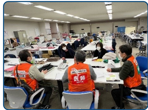
金沢市保健所で所長、 保健師と情報共有を行う

このたび山口県医師会の派遣要請を受けて「JMAT やまぐち」として石川県で医療支援活動を行って来ました。「JMAT やまぐち」が与えられた活動内容は能登半島の1次避難所から金沢市以南のホテルや宿泊施設、約250カ所の2次避難所へ避難されてきたおよそ5200人の方たちの健康状態を把握するべく、その中から金沢市内の31施設を割り当てられ施設をまわり、必要があれば診察、処方、健康相談を行うものでした。しかしながら、ビジネスホテルなど一つ一つ訪ねる訳にもいきません。そこで、金沢市内の保健師と情報を共有、共働することが大事と考え、金沢市の保健所へ赴き情報を共有し、それを基に施設を訪ねホテルのロビーやお部屋の中で、出来る限りの診察や健康相談を行いました。能登の方たちはとても忍耐強く、話を聞いて初めて「実は、足が腫れてきて…」とか、「実は、咳が止まらなくて…」など体のつらさを教えてくれました、話を聞くという行為の大切さを感じました。