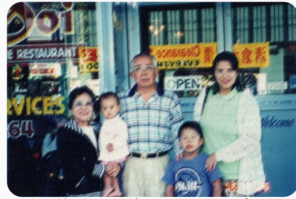
メルボルン留学中に様子を見に来た父と母

私事ですが、2024年1月28日父が亡くなりました。92歳でしたので大往生ではありますが、覚悟していた以上に心の中の大きな支えを失いました。