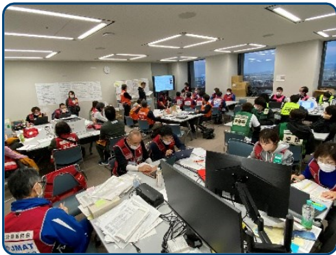
全国から集まった JMAT で本部ミーティング

さて、長門総合病院は災害拠点病院であることをご存じでしょうか？その為、山口県の要請を受けて災害超急性期に活動できる災害医療支援チーム（DMAT）を有しています。それと同時に日本医師会災害医療チーム（JMAT）にも登録しています。JMATとは被災された方の生命と健康を守り、被災地の公衆衛生および地域医療の再生を支援する目的で組織されたもので、被災地の地域医療を取り戻す目的があります。